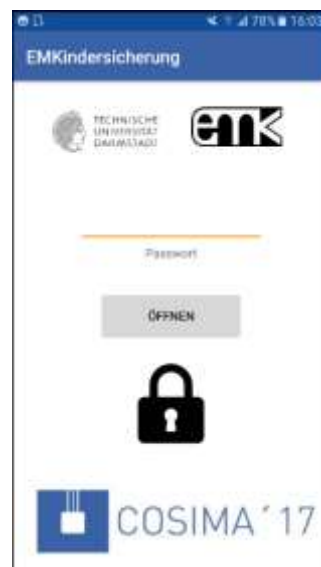
Abb.3: Bedienoberfläche der NFC-App