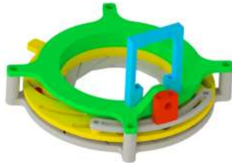
Abb.1.2: Konzept des Schließmechanismus

Zum Öffnen der Sicherung wird eine selbst programmierte App (Abb.3) verwendet, welche nach vorheriger Passwortabfrage über NFC dem Gerät ein Öffnungssignal gibt. Infolgedessen wird der Aktor mit Hilfe einer Leistungsregelung, die durch einen Arduino Mini gesteuert wird, bestromt und erwärmt sich. Durch diese Erwärmung verformt sich das Material des Aktors und der Stift wird aus der Sicherung herausgezogen. Das Gerät kann geöffnet und von der Flasche heruntergenommen werden. Der Zugriff auf das Putzmittel ist gewährleistet. Nach Verwendung des Putzmittels wird das Gerät wieder über den Deckel der Flasche gesteckt und der Schließmechanismus betätigt. Das Gerät ist dann vor unberechtigtem Zugriff geschützt und verhindert somit, dass Kinder die schädlichen Inhalte zu sich nehmen (Abb.2).