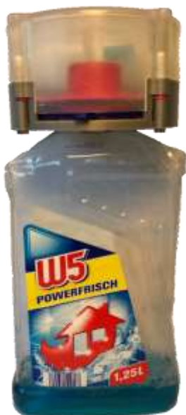
Abb.2: EMKindersicherung mit Deckel auf der Reinigerflasche, im gesicherten Zustand

Zum Öffnen der Sicherung wird eine selbst programmierte App (Abb.3) verwendet, welche nach vorheriger Passwortabfrage über NFC dem Gerät ein Öffnungssignal gibt. Infolgedessen wird der Aktor mit Hilfe einer Leistungsregelung, die durch einen Arduino Mini gesteuert wird, bestromt und erwärmt sich. Durch diese Erwärmung verformt sich das Material des Aktors und der Stift wird aus der Sicherung herausgezogen. Das Gerät kann geöffnet und von der Flasche heruntergenommen werden. Der Zugriff auf das Putzmittel ist gewährleistet. Nach Verwendung des Putzmittels wird das Gerät wieder über den Deckel der Flasche gesteckt und der Schließmechanismus betätigt. Das Gerät ist dann vor unberechtigtem Zugriff geschützt und verhindert somit, dass Kinder die schädlichen Inhalte zu sich nehmen (Abb.2).