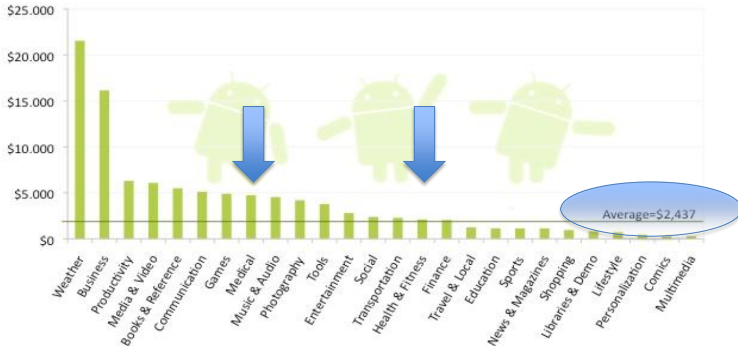
Average total cumulated revenue per paid app by category in Android Market (August 2011)